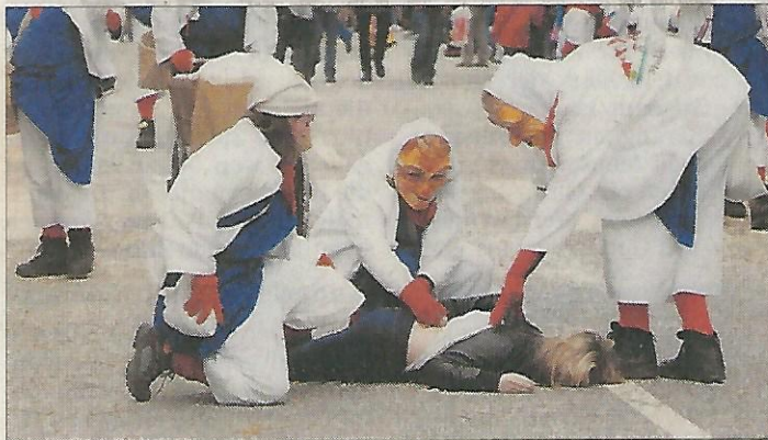
Kein Entrinnen (I): Die Etjer Mühlenjockel stempeln ihr »Opfer«.