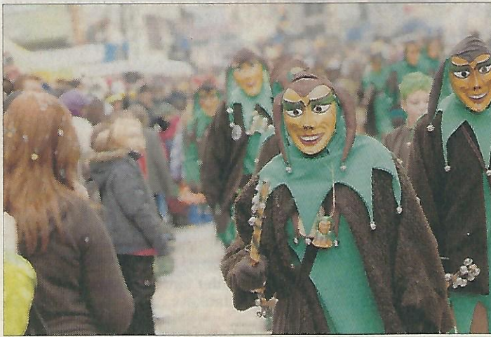
Immer mit einem Lächeln unterwegs: die Oberacher Jockele.