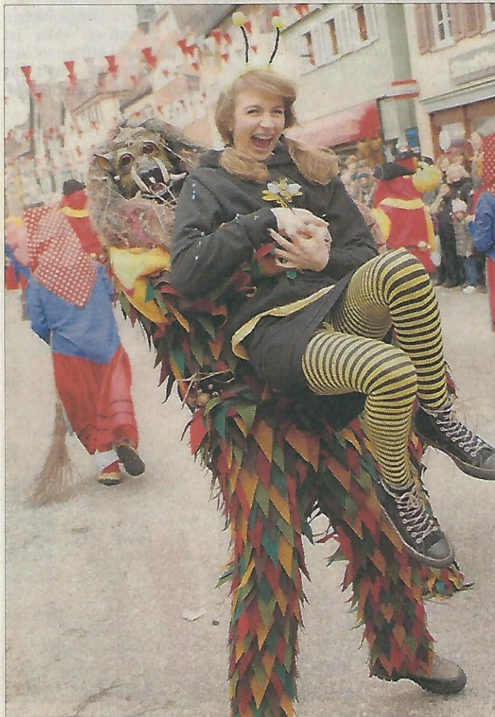
Geschnappt: Den Narren ging manch heiße Biene ins Netz.